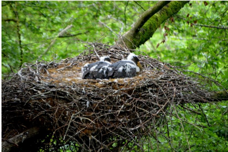
Photo : Nid occupé par le couple du Val d'Orsoy. Printemps 2021